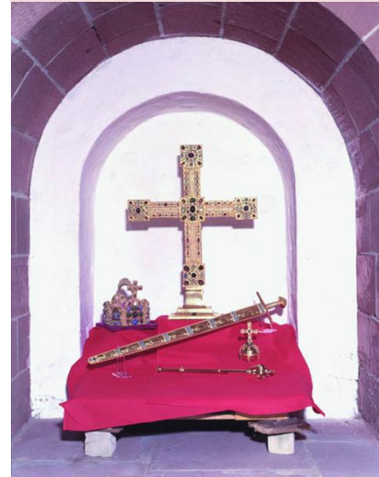
Hort der Reichsinsignien

Burg Trifels 76855 Annweiler bsa@gdke.rlp.de