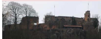
Auf einem Felsporn des Kahlenbergs über der Stadt Landstuhl im Kreis Kaiserslautern thront die mächtige Schlossruine Nanstein.

Schlossruine Nanstein 66849 Landstuhl bsa@gdke.rlp.de