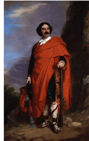
Fra Diavolo, Opernkostüm, Gemälde, ca. 100 Jahre alt