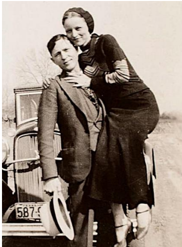
Bonnie und Clyde, ca. 1933, in ihrem Privatbesitz gefunden