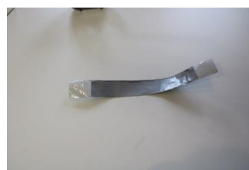
Hier noch eine Methode, wie Du nur mit Panzertape die Klebestreifen herstellst.