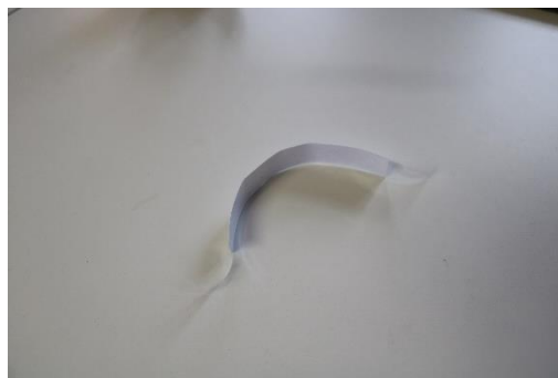
Die beiden Klebestreifen, wie oben beschrieben.