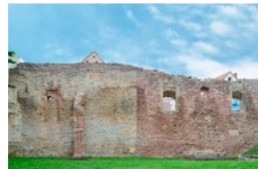
10) Synagoge und Frauenschul, Speyer