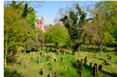
6) Friedhof „Heiliger Sand“, Worms