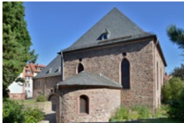
11) Synagogenbezirk, Worms

Während der Schoah wurde die Synagoge zerstört. 1957 begann man unter Verwendung originalen Materials mit der Wiedergewinnung der Synagoge. Die Mikwe wird auf das Jahr 1185/86 datiert. Die Keller des heutigen „Raschi-Hauses“ gehen auf das 12. und 13. Jahrhundert zurück.