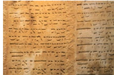
3) Grabinschrift, Speyer

Aus dieser Zeit sind einzigartige Ensembles, Monumente und Friedhöfe erhalten, die bis heute fassbare Zeugnisse der Wiege des mittel-, nord- und osteuropäischen Judentums – des aschkenasischen Judentums – sind. Bis heute sind für orthodoxe Jüdinnen und Juden Rechtsentscheide sowie Bräuche, Riten und Gewohnheitsrechte (Minhagim) der rheinischen Gelehrten gültig.