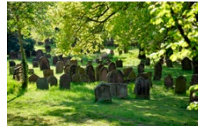
13) Friedhof „Heiliger Sand“, Worms

Insgesamt sind heute ca. 2500 Grabmale aus der Zeit zwischen dem 11. und 20. Jahrhundert erhalten. Dies macht den Friedhof „Heiliger Sand“ in Worms zum ältesten unzerstört erhaltenen jüdischen Friedhof Europas, der mit einzigartiger Kontinuität seit dem Mittelalter bis ins 20. Jahrhundert genutzt wurde.