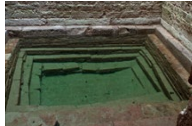
4) Tauchbecken der Mikwe, Speyer