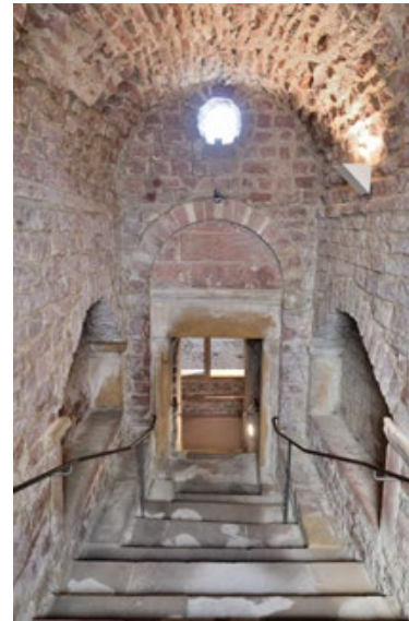
9) Treppenabgang der Mikwe, Speyer

Die Speyerer Mikwe ist die älteste (1110/1120) bekannte und zugleich typbildende Monumentalmikwe. Das architektonisch aufwendig gestaltete Ritualbad wurde als separates Bauwerk errichtet und wird als Monumentalmikwe bezeichnet. Der außerordentliche Bauaufwand verdeutlicht die hohe Bedeutung kultureller Reinheit für Männer und Frauen.