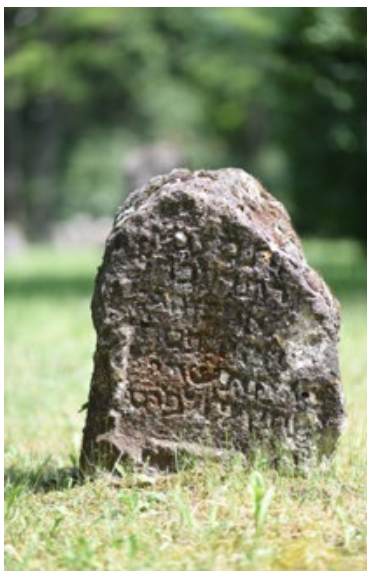
15) Grabstein auf dem Denkmalfriedhof, Mainz