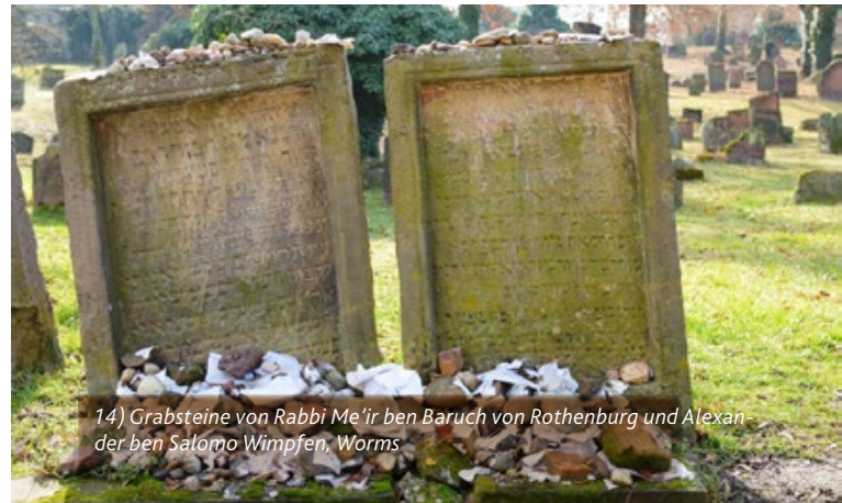
14) Grabsteine von Rabbi Me'ir ben Baruch von Rothenburg und Alexander ben Salomo Wimpfen, Worms