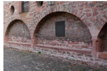
7) Synagogenhof mit Sitzbänken, Worms