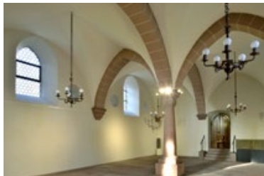
12) Innenansicht der Frauenschul, Worms